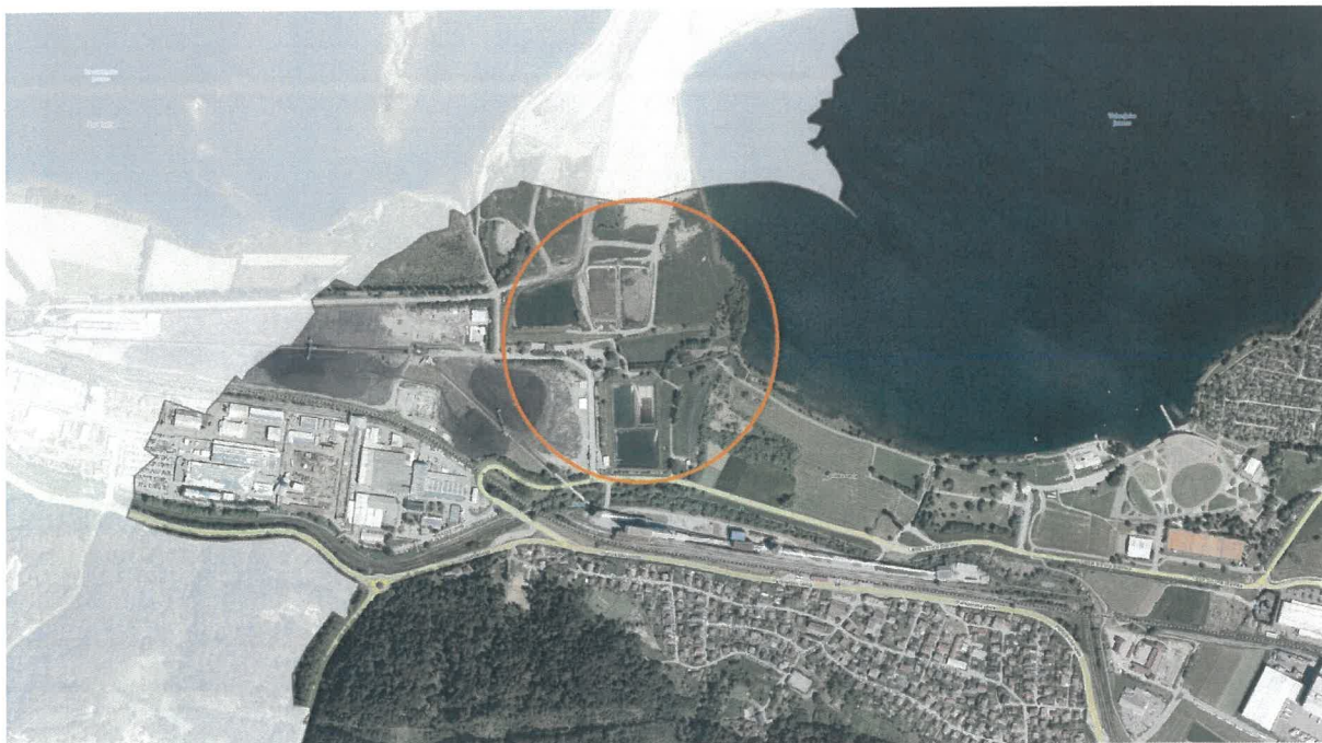
Lokacija širše - podlaga PISO